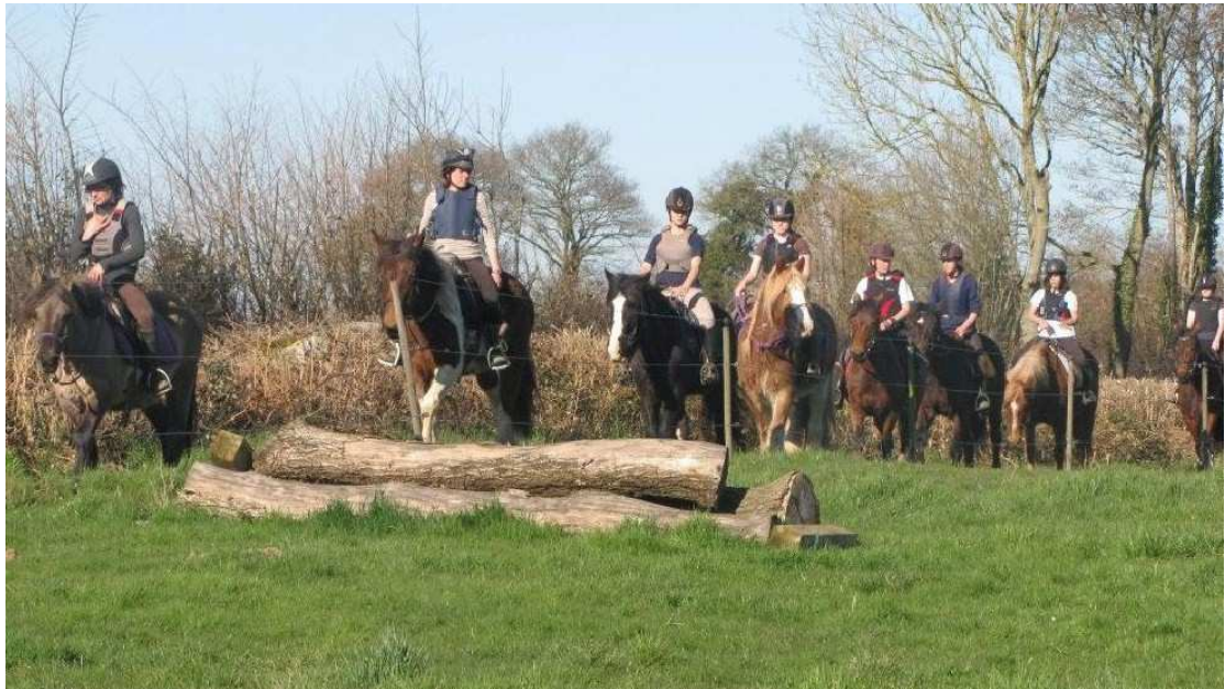
志趣相投的小伙伴在熟悉赛道环境