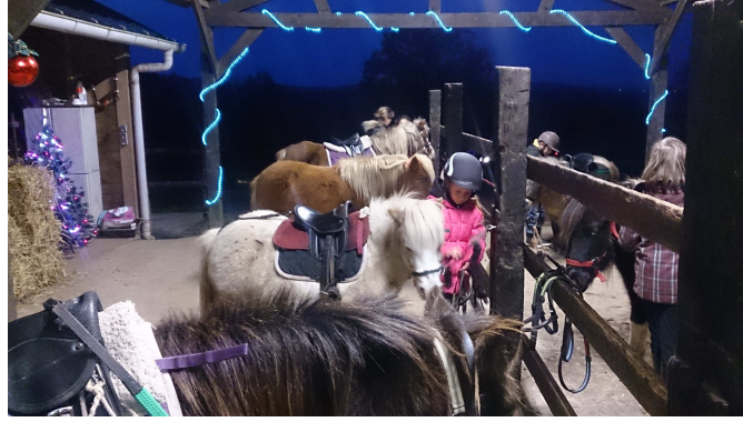
各自打理自己的马