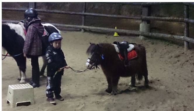
我2岁,就是喜欢骑马