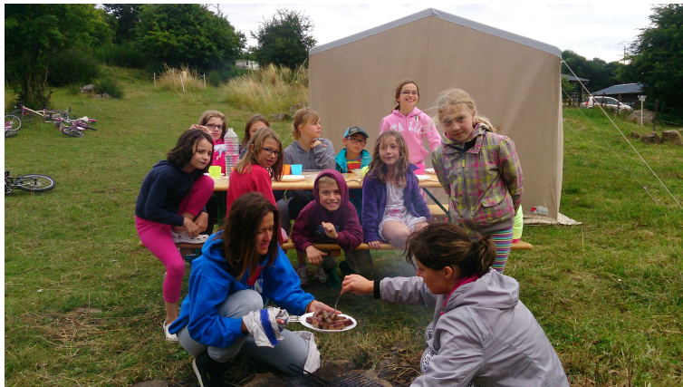
香喷喷的牛肘子来了