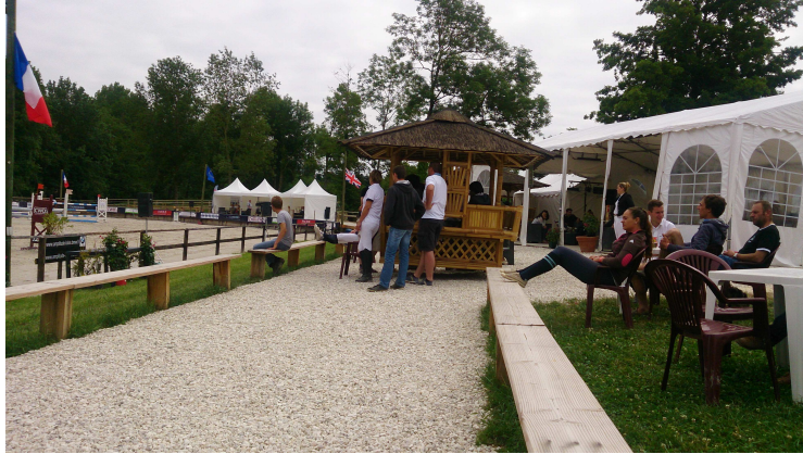
万事具备，只欠东风