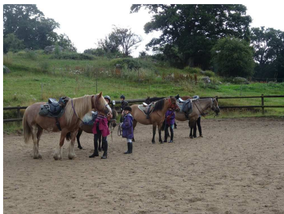
小骑手训练科目：自备鞍具